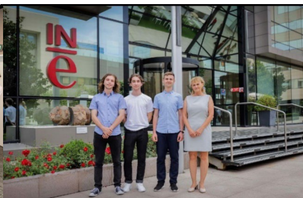
Tím PERO4F (kategória A) v Madride