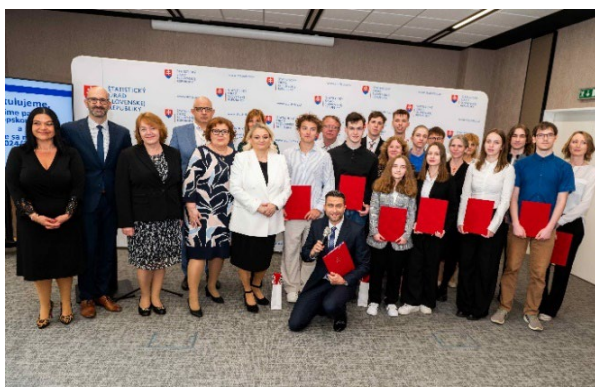
Vítazi národného kola Európskej súťaže v štatistike s členmi slovenskej odbornej poroty

Slovenské tímy dosahujú mimoriadny úspech aj v európskom kole. V druhom ročníku ESC 2023/2024 tím PERO4F z Gymnázia Jozefa Gregora Tajovského v Banskej Bystrici získal 2. miesto v kategórii A a tím SECONDTRY z Gymnázia Ivana Kraska v Rimavskej Sobote získal 2. miesto v kategórii B. Tím TURBO z Gymnázia Považská Bystrica sa umiestnil na 4. mieste v kategórii A.