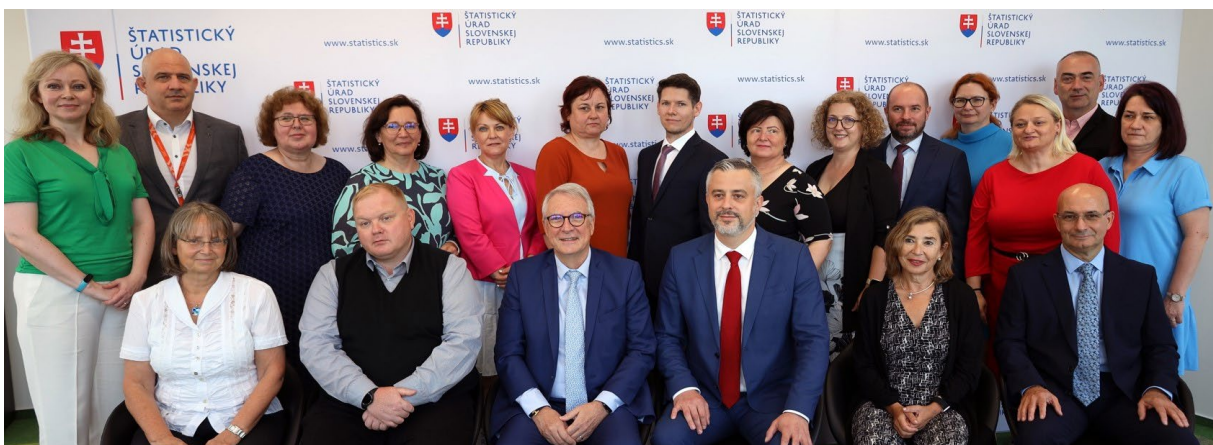
Zdroj: Štatistický úrad SR

Partnerské preskúmanie takéhoto charakteru je okrem iného aj vynikajúcou príležitosťou pre zamestnancov ŠÚ SR na všetkých úrovniach získať neoceniteľné skúsenosti a prax. Najbližšie kolo Peer review by sa malo konať o ďalších 7 – 8 rokov.