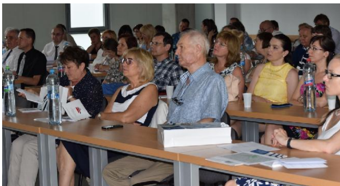
Pohľad na účastníkov 18. slovenskej štatistickej konferencie v Košiciach

Autorka pôsobí na Fakulte managementu Univerzity Komenského v Bratislave, je predsedníčkou Slovenskej štatistickej a demografickej spoločnosti.